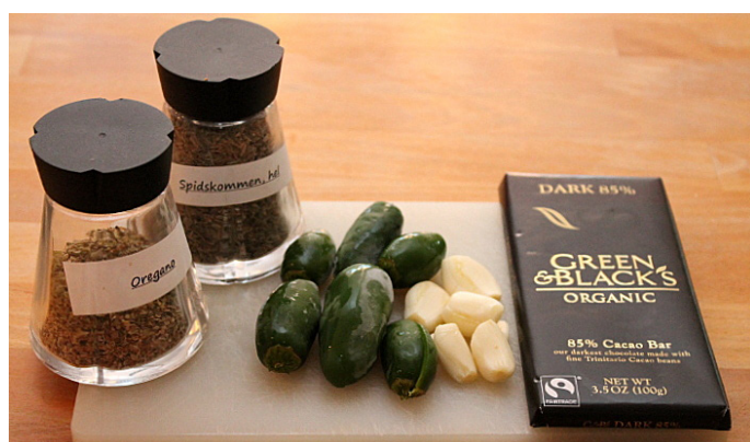
Grønsager i kombination med chokolade

ULN skal tale med iværksætterne fra Audere, fordi de udnytter de lokale ressourcer til at skabe en virksomhed, der markedsfører sig på lokale råvarer i kombination med deres passion for chokolade. Der er iværksættere i Vejle Kommunes landdistrikter, men kunne der findes inspiration i en italiensk model, så der kunne blive grobund for flere virksomheder i landdistrikterne – flere arbejdspladser, flere muligheder for branding?