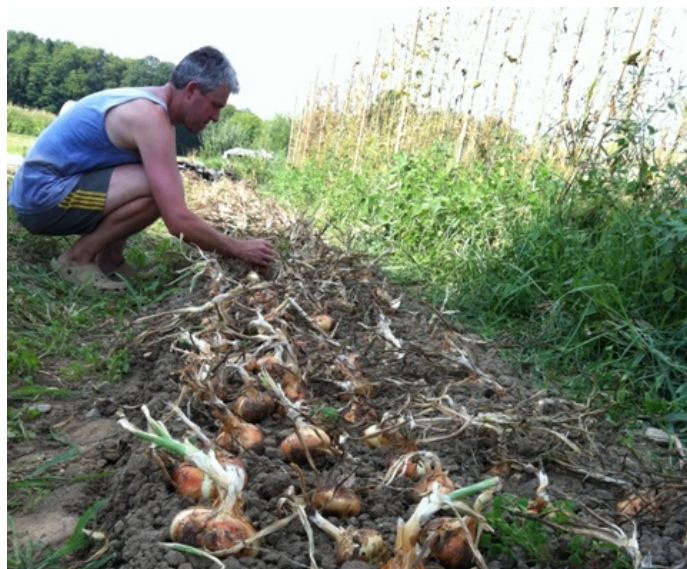
Bonde fra Cureggio