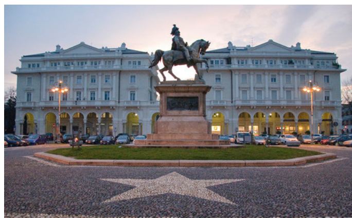
Piazza Martiri della Libertà

Det største torv er Piazza Martiri della Libertà domineret af en rytterstatue af Victor Emmanuel II, Italiens første konge. På pladsen står Castello Visconteo-Sforzesco, engang større end det kompleks, der er tilbage i dag, og omgivet af Allea, en af de største offentlige haver i Novara.