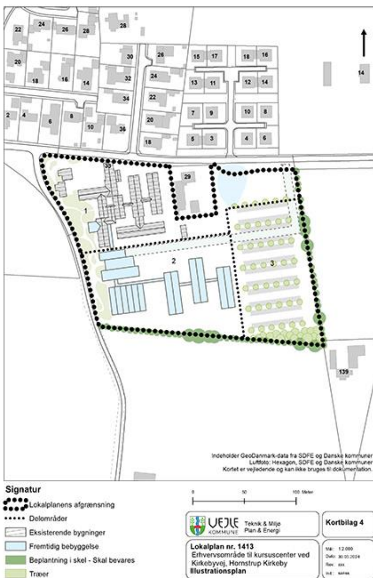
Figur 1: Lokalplanens kortbilag 4. Illustration af fremtidig indretning af lokalplanområdet.