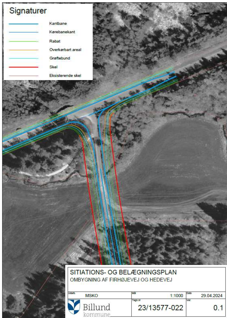
Figur 2. Forlængelse af overkørslen over Vandel Bæk ved Hedevej (ikke målfast).

Som en del af udbygningen af Hedevej skal rørunderføringen ved Vandel Bæk forlænges, så den opnår en samlet længde på 20 m. Samtidig udskiftes de nuværende to Ø 60 cm rør til et Ø 125 cm rør.