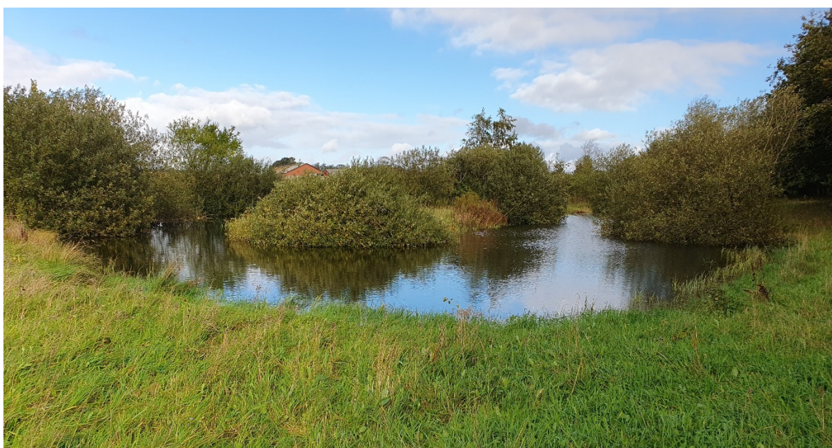
Den gamle krebsedam set fra sydvest

Vandhullet er oprindeligt etableret som en krebsedam mellem 1990 og 1992. Vandhullet er udformet som en lang kanal, der er foldet sammen omkring en smal tange. Udformningen skulle give øge brinkarealet idet krebsene typisk bor i vandhullets brinker. Vandhullets sydlige brink følger akkurat fortidsmindebeskyttelseslinjen.