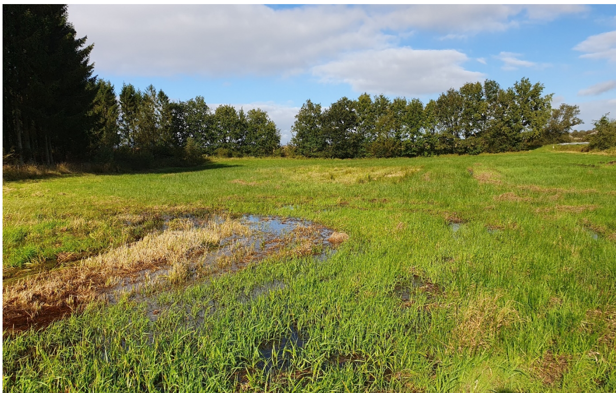
Vandhullet ønskes etableret i en fugtig lavning i en kultureng.

Arealet er en del af Omme Å VMP II vådområdeprojekt, som blev gennemført omkring 2006. Da kommunen er tilbageholdende med at tillade opgravning af tørveholdig jord og dermed øge frigivelsen af CO 2 , har Præstevejens Jord og Vandhuller A/S efterfølgende foretaget boreprøver for at fastslå om der er tale om tørveholdig jord. Det viste sig at der ikke blev fundet indhold af tørv, men derimod 30-35 cm sortgrå muld, derunder 30-40 cm grålig sandbladet jord. Under det sandblandede jord findes ren sand.