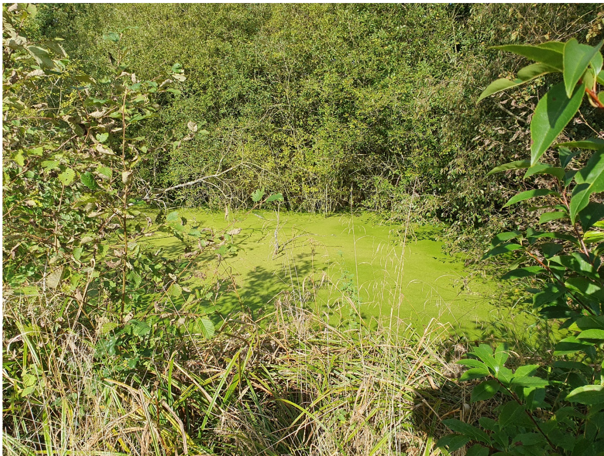
Vandhul nr. 2 er omgivet af buske og træer og helt dækket af liden andemad

Der blev registreret følgende arter omkring vandhullet: glansbladet hæg, mosebunke, skovkogleaks, birk, pil sp., rødæl, og lysesiv.