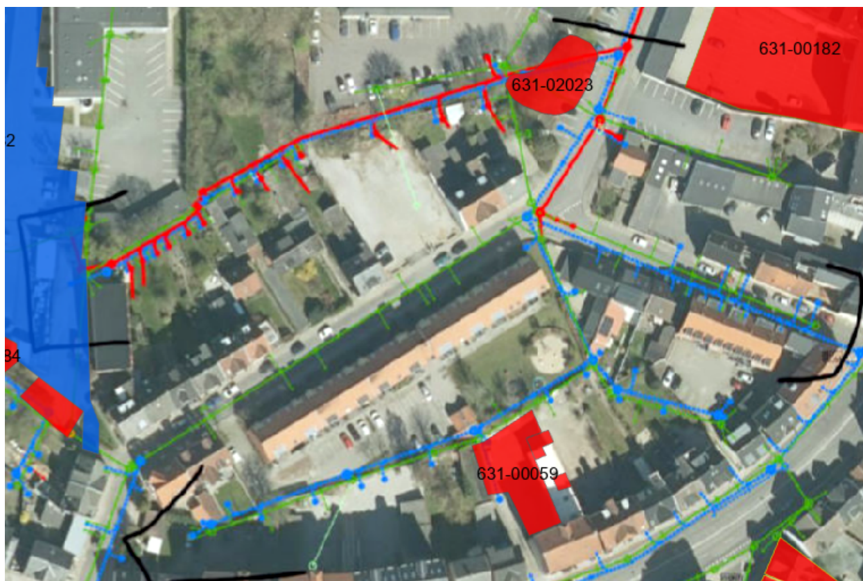
Figur 2: Ledningsarbejde i nærheden af Kortlagt områder (røde polygoner)