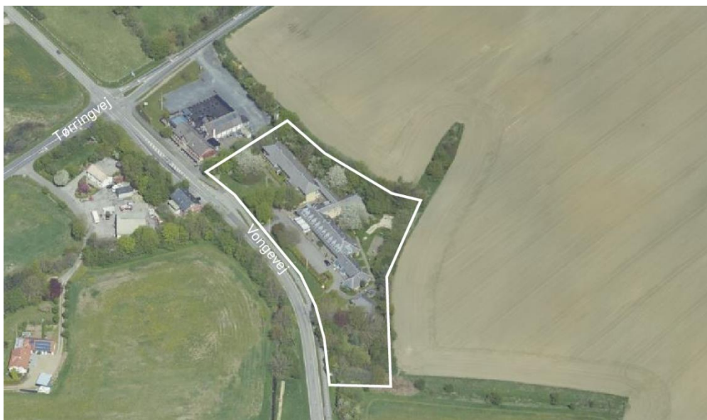
Figur 1 Skråfoto af lokalplanområdet set fra syd. Lokalplanens afgrænsning er vist med hvid streg. Indeholder GeoDanmark-data fra Geodatastyrelsen og Danske kommuner, maj 2023.