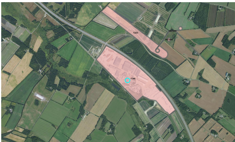
Figur 1 - Oversigtskort – lokalplanområde (ikke målfast)

Udvidelsen sker i et område, som er omfattet af lokalplan 1346 – erhvervsområde ved Svindbækvej og Vejlevej, Svindbæk. Lokalplan 1346 blev vedtaget i 2023 og fastholder områdets anvendelse til erhvervsområde. Miljøklassen for virksomheder indenfor lokalplanområdet er i 2023 blevet ændret til 4-6. Nedenstående figurer viser dels lokalplanområdet og situationsplan over virksomheder.