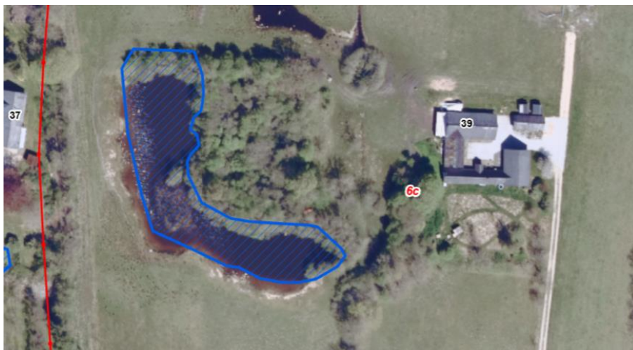
Figur 1: Luftfoto fra 2023, der viser den beskyttede sø, som er udvidet. Den blå skravering angiver det oprindeligt registrerede beskyttede sø-areal og røde linjer viser matrikelgrænser.