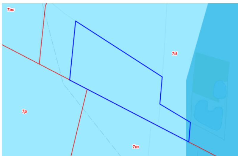
Figur 4. Oversigtskort, der med blå streg markerer det anmeldte skovrejsningsareal sammen med lys blå markering af drikkevandsinteresser. Mellemlå flade angiver 'Særlige drikkevandsinteresser'. Røde linjer markerer matrikelgrænser. ©Vejle Kommune, SDFE.