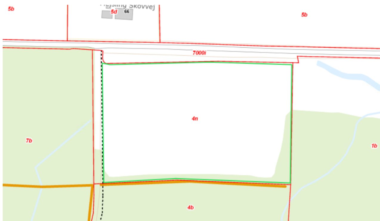
Figur 3. Oversigtskort, der med grøn streg markerer det anmeldte skovrejsningsareal sammen med markering af beskyttede diger som orange linjer. Røde linjer markerer matrikelgrænser.

Det anmeldte areal grænser mod syd op til et beskyttet dige, som vist i figur 2. Der må ikke beplantes inden for 2 m til digefoden af de beskyttede diger.