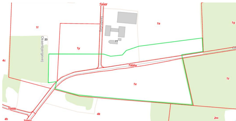
Figur 1. Oversigtskort med angivelse af det anmeldte skovrejsningsareal, markeret med grøn streg. røde linjer er matrikelgrænser.

Figur 1 viser et oversigtskort over det anmeldte skovrejsningsareal.