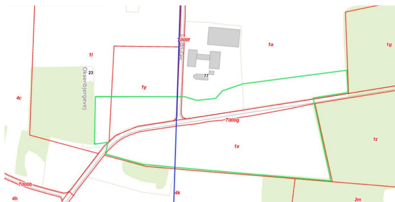
Figur 3. Oversigtskort, der med grøn streg viser det anmeldte skovrejsningsareal. Med blå streg er vist en nord-syd-gående spildevandsledning gennem området.