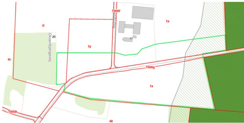
Figur 2. Oversigtskort, der med grøn linje viser det anmeldte skovrejsningsareal og arealer i området udpeget til 'Økologisk forbindelse', vist med mørk grøn flade. Grøn skravering markerer arealer udpeget til 'Potentiel økologisk forbindelse'.