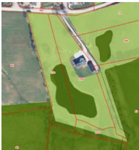
Kortbilag: Potentielle naturområder.

I denne sag har Natur&Udeliv vurderet, at ridebanen kan accepteres på den ansøgte placering