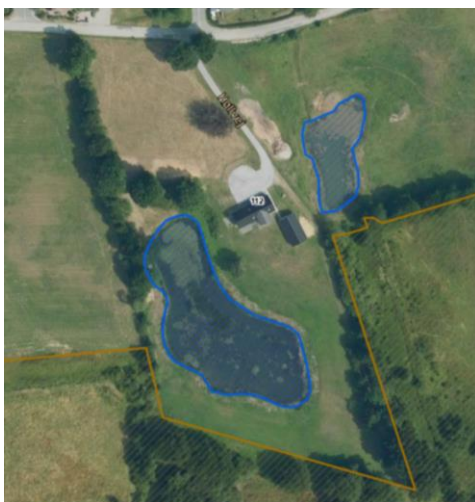
Kortbilag: §3 søer markeret med blå.

Det vurderes at en ridebane godt kan placeres i nærhed til §3 søen på matr. Nr. 11c. såfremt den holdes med en afstand på minimum 10 m fra brinken. Her er dog vurderet at der skal holdes en afstand på yderligere 10 meter for også at holde en afstand fra trægruppen nord for søen, hvorfor ridebanen skal holde en samlet afstand på minimum 20 meter fra brinken.