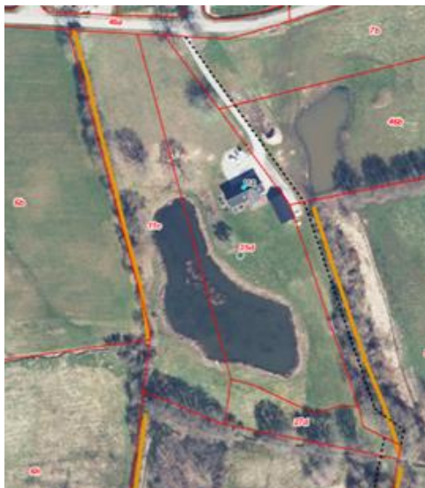
Kortbilag: De orange streger viser beskyttede sten- og jorddiger.

Der skal, ved etablering af en ridebane, holdes en afstand på minimum 2 meter ind til digets kantfod.