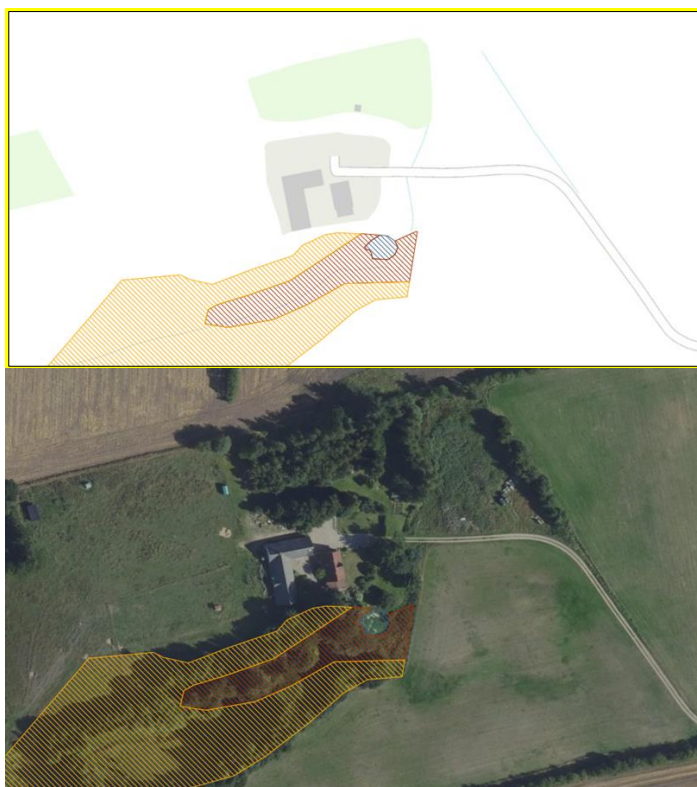
Figur 1. Overblikskort, der viser arealet omkring det registrerede, beskyttede vandhul, som du ansøger om at oprense og udvide, markeret med blå skravering. Brun skravering markerer beskyttet

Vejle Kommune har den 4. september 2023 modtaget din ansøgning om tilladelse/dispensation til at oprense og udvide et vandhul på din ejendom matr.nr., 9A, VESTERBY BY, ØDSTED beliggende på adressen Mølkærvej 15, 7100 Vejle. Din ejendom ligger i landzone, og projektet kræver derfor også en dispensation fra Planloven. Det område, hvor du ønsker at tilpasse vandhullet, er vist på kortene i figur 1 og 2.