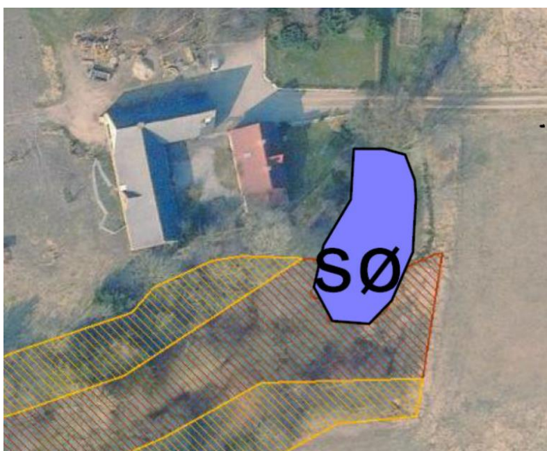
Figur 2. Oversigt fra ansøgningsmaterialet, der viser det beskyttede vandhuls planlagte afgrænsning efter udvidelse. Blå flade er vandhul. Brun skravering er beskyttet mose. Gul skravering er beskyttet overdrev.

Du meddeles hermed dispensation til at oprense og udvide et beskyttet vandhul, som du har søgt om efter § 65, stk. 2, jf. Naturbeskyttelseslovens generelle bestemmelser om beskyttede vandhuller og søer, jf. § 3 stk. 1 1 samt tilladelse efter § 35, stk. 1, i Planloven 2 . Den planlagte afgrænsning og udbredelse af vandhullet er vist i figur 2.