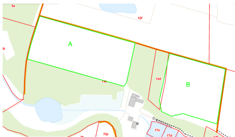
Figur 3. Oversigtskort, der med grøn linje viser det anmeldte skovrejsningsareal sammen med beskyttede diger i omgivelserne, vist med gul streg. Røde linjer er matrikelgrænser.

Der må ikke tilplantes op til 2 m fra digefoden for de beskyttede diger.