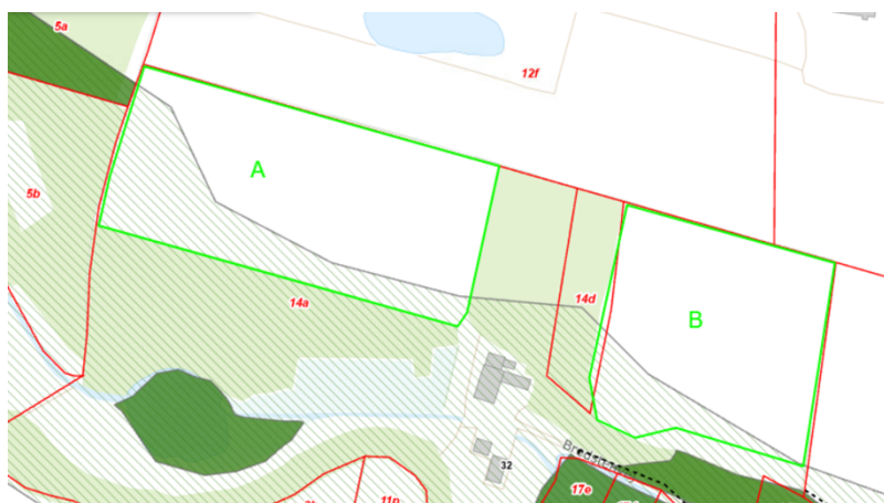
Figur 6. Oversigtskort, der med grøn linje viser det anmeldte skovrejsningsareal og arealer i området udpeget til 'Økologisk forbindelse', vist med mørk grøn flade. Grøn skravering markerer arealer udpeget til 'Potentiel økologisk forbindelse'.

bevægelsesveje. Vejle Kommune vurderer, at skovrejsning på det anmeldte areal kan gavne udpegningsformålet. Udpegningen ses på kort i figur 6.