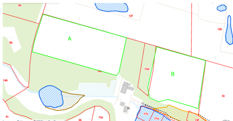
Figur 2. Oversigtskort, der med grøn linje viser det anmeldte skovrejsningsareal sammen med arealer i området med beskyttet natur. Blå skravering er beskyttet vandhul. Brun skravering er beskyttet mose. Orange skravering er beskyttet overdrev. Røde linjer er matrikelgrænser. ©Vejle Kommune, SDFE.

Vejle Kommune præciserer, at der ikke må tilplantes tættere end 20 m til de beskyttede naturarealer, inkl. til enhver del af det registrerede overdrevsareal mod sydøst.