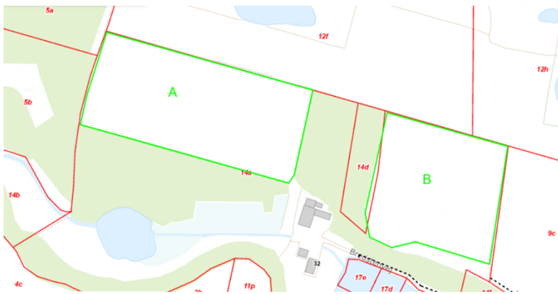
Figur 1. Oversigtskort med angivelse af de anmeldte skovrejsningsarealer, markeret med grøn streg. røde linjer er matrikelgrænser.

Figur 1 viser et oversigtskort over de anmeldte skovrejsningsarealer. Der er tale om et areal A mod vest samt et areal B mod øst.