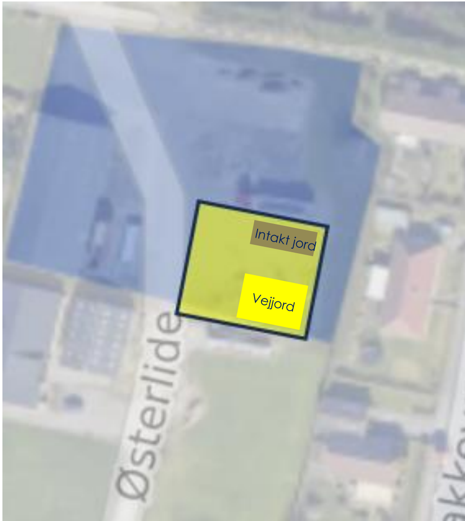
Oversigt over mellemdpot

På vegne af Aarsleff og Give Fjernvarme søger Melgaard+co ApS tilladelse efter miljøbeskyttelseslovens § 19 til midlertidig mellemdponering af vejjord fra fjernvarmeprojekt. Ligeledes ansøges om genindbygning på aktuelle vejarealer af lettere forurenede jord. Forurenede jord bortkøres til godkendt modtager.