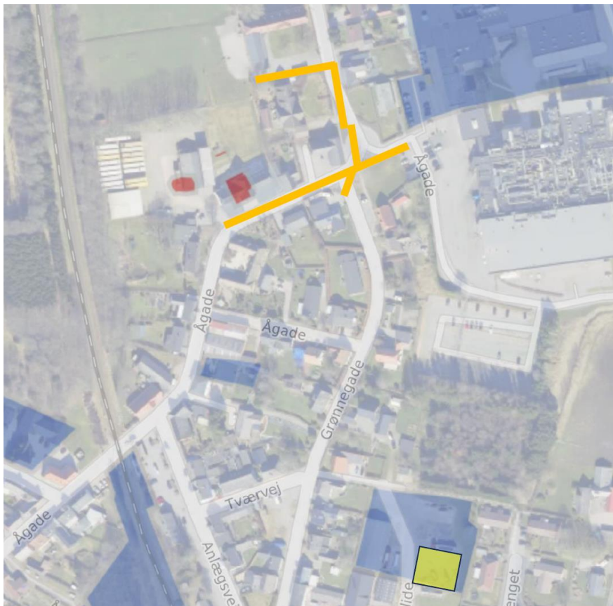
Figur 1. Oversigt over projekt.

Melgaard+Co ApS er anmodet om rådgivning i forbindelse med jordhåndteringen.