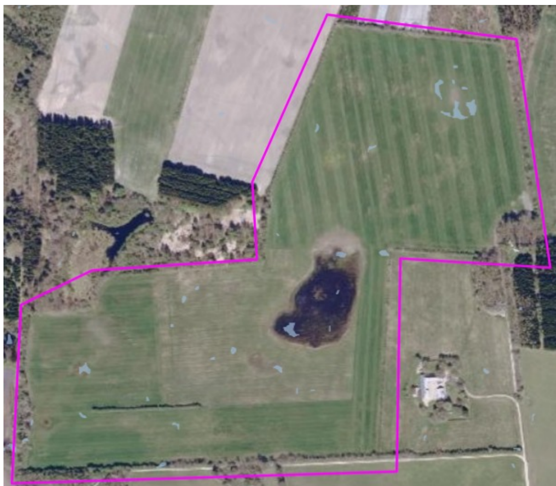
Figur 9: Områder, der forventeligt vil være særligt påvirkede i forbindelse med skybrud, er markeret med lyseblå.

Dele af området er markeret som værende særligt sårbare for påvirkning i forbindelse med skybrud og store regnvandsmængder. Skovrejsningen vil være med til at suge vand fra arealet, og vil derfor ikke være en hindring for projektets udførelse. De markerede områder ses på figur 10.