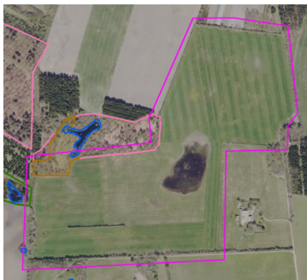
Figur 2: Oversigtskort med markering af beskyttet natur (Lyserød: hede, lysebrun: mose, grøn: eng, brun: mose, mørkeblå: sø,). Matrikelgrænser er vist med magenta linjer.

Der er dele af beskyttet natur på matriklerne. Der skal holdes en afstand på 20 meter til disse. Figur 2 viser et oversigtskort for beskyttet natur i området.