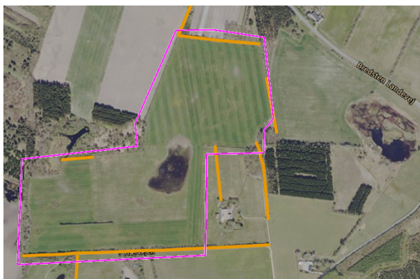
Figur 4: Oversigtskort med markering af beskyttede diger som orange linjer. Magenta linjer markerer projektområdet.

Der er beskyttede diger på og omkring det pågældende areal. Der må ikke beplantes inden for 2 meter til digefoden af de beskyttede diger. Digerens placering er specificeret i figur 4.