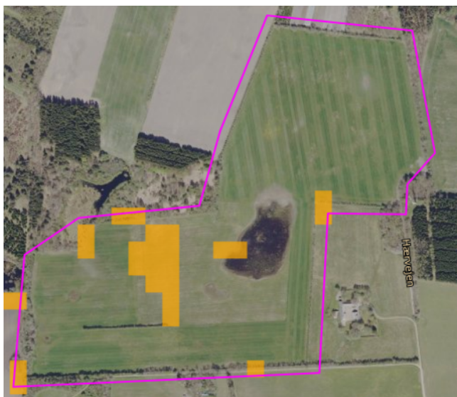
Figur 8: Arealer med tørvejord på 6-12 % er markeret med mørkegul. Projektarealets grænse markeret med magenta.

Kommunen anbefaler dog, at indtænke arealets topografi i planlægningen, så de lavtliggende områder enten holdes åbne eller tilplantes med planter, der trives i vandlidende jord.