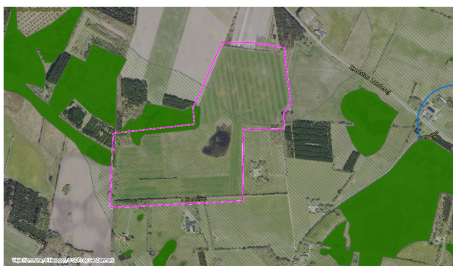
Figur 7: Udpegede økologiske forbindelser vises med grønne flader. ©Vejle Kommune, SDFE.

Dele af det anmeldte areal ligger inden for udpegningen af økologiske forbindelser. Formålet med udpegningen er at sikre sammenhæng mellem naturområder for at give bedre muligheder for spredningen af de levende organismer i naturen. Vejle Kommunen vurderer, at skovrejsning på det anmeldte areal kan gavne udpegningsens formål. Udpegningen ses på kort i figur 7.