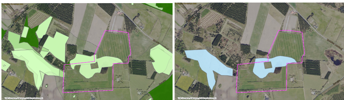
Figur 10: Til venstre ses det areal, der er udpeget til skovrejsning uønsket (markeret med pastelgrønne flader) i kommuneplanen, mens kortet til højre viser, hvilke dele af arealet, der er udpeget til lavbundsprojekter (markeret med lyseblå flader).

Dele af arealet er i kommuneplanen markeret med skovrejsning uønsket. Det fremgår af Kommuneplanen 2021-2023, at udpegningen om 'skovrejsning uønsket', kan være begrundet med mulige lavbundsprojekter. Som nævnt i afsnittet om lavbundsareal, er tørveindholdet i jorden dog så lavt, at et skovrejsningsprojekt vurderes at have en natur- og klimaværdi, der som minimum er tilsvarende et lavbundsprojekt på arealet.