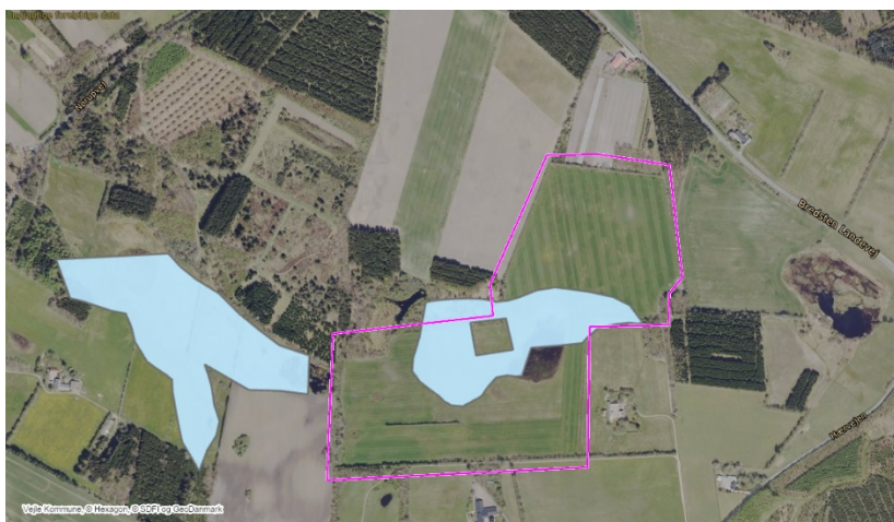
Figur 9: Områder udpeget til lavbundsareal er vist med lyseblå flader, mens projektarealet indkredses af den magenta linje.