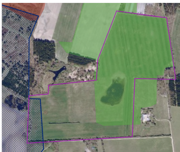
Figur 11: Områdets råstofinteresser. Skraveret blå: råstofinteresseområde. Grøn flade: tilladt graveområde. Rød: færdigetableret råstofområde.

Dele af området er omfattet af råstofinteresser, hvorfor der ikke kan meldes fredsskovspligt på arealet. Der kan godt foretages en skovrejsning, men fredsskovsplikten kan ikke gælde på arealet, da dette skal sikre, at en eventuel råstofindvinding kan foretages ved at rydde skoven. Områdets råstofinteresser fremgår af figur 12.