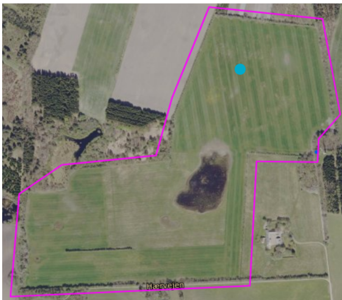
Figur 3: Den blå plet viser Slots- og kulturstyrelsens markering af en tidligere bosættelse fra stenalderen.

Der ligger ikke fredede fortidsminder inden for eller grænsende op til det anmeldte areal. VejleMuseerne er blevet hørt i forbindelse med skovrejsningsprojektet, og VejleMuseerne bemærker, at skovrejsning vurderes som uproblematisk i forhold til fortidsminder, såfremt der ikke laves dybdepløjning eller jordarbejde, der går dybere end denne i forbindelse med skovrejsningen. På figur 3 ses placeringen af det ikke-fredede fortidsminde, der er fundet på arealet.