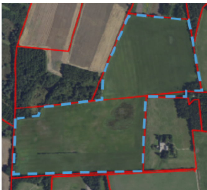
Figur 1: Oversigtskort med angivelse af det anmeldte skovrejsningsareal, markeret med stiplede lyseblå linje. Røde linjer er matrikelgrænser.

Skovrejsning er omfattet på Miljøvurderingslovens bilag 2, pkt. 1d 2 . Derfor skal kommunen udføre en VVM-screening af din ansøgning med henblik på at vurdere, om dit projekt evt. kan føre til en væsentlig ændring af miljøet, og på den baggrund skal kommunen afgøre, om projektet er omfattet af miljøvurderingspligt. Vejle Kommunes VVM-screening og afgørelse i forbindelse med din skovrejsningsanmeldelse fremgår af side 3.