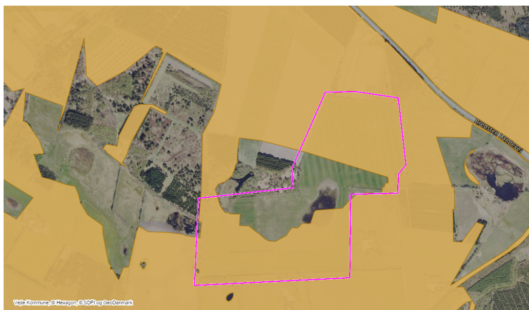
Figur 6: Særligt værdifulde landbrugsjorde er vist med lysebrune-gule flader. Projektområdet er illustreret med den magenta linje.

Det anmeldte areal ligger inden for udpegningen af særlige værdifulde landbrugsområder (SVL), der kan ses på figur 6. Det overordnede formål med SVL er at udpege arealer, der fastholdes til landbrugsformål for at sikre produktionen af afgrøder og husdyr. I retningslinjerne for SVL angives det, at der kan indgås aftaler med lodsejere om skovrejsning, etablering af vådområder mm., der kan ændre arealets status fra at være SVL. Derfor vurderer Vejle Kommune, at skovrejsning kan foretages på det anmeldte areal.