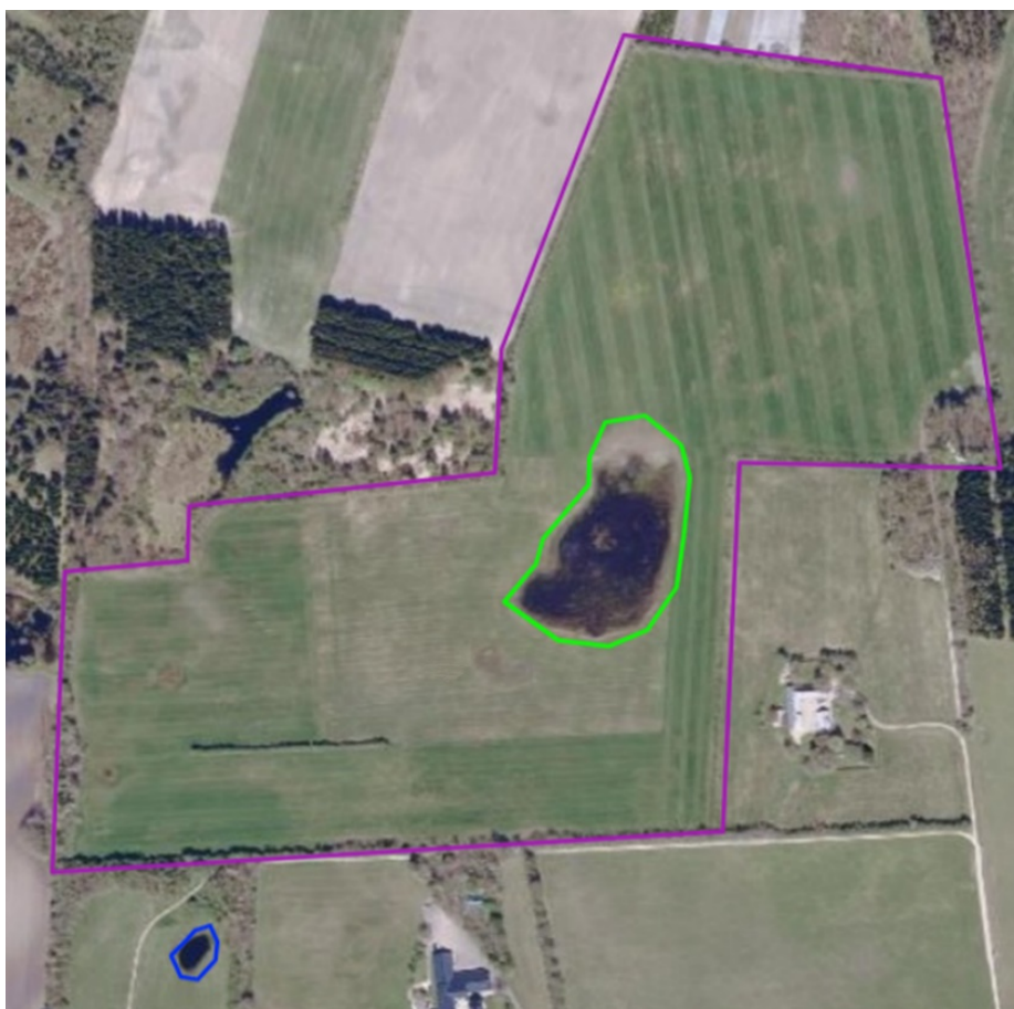
Figur 13: Vandhullet på arealet er markeret med grøn streg og vandhullet med fund af stor vandsalamander markeret med mørkeblå streg. Projektområdet er vist med lilla streg. ©Vejle Kommune, SDFE.