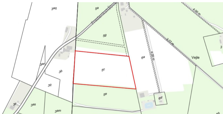
Figur 1. Oversigtskort med rød markering af afgrænsningen af det anmeldte skovrejsningsareal. Tynde sorte linjer er matrikelgrænser, tyk sort linje er kommunegrænse, stiplede linjer markerer mindre veje.

Vejle Kommune har den 5. januar 2024 modtaget din anmeldelse af skovrejsning på matr.nr. 5c, Guldbergsminde, Randbøl på adressen Frederikshåbsvej 7, 6623 Vorbasse. Ifølge §§ 8 og 9 i Bekendtgørelse om jordressourcens anvendelse til dyrkning og natur 1 , skal du anmelde/ansøge om skovrejsning, inden du planter skoven. Figur 1 viser et oversigtskort over det anmeldte skovrejsningsareal.