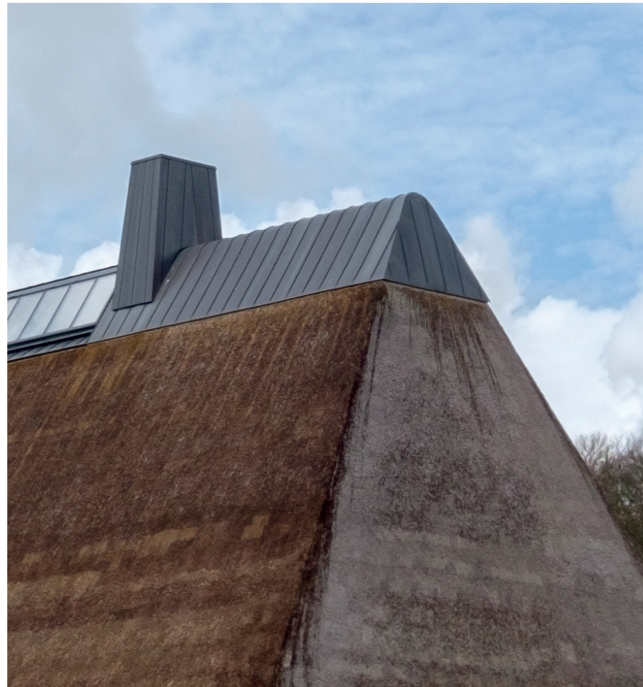
Stråtag - som Højgård