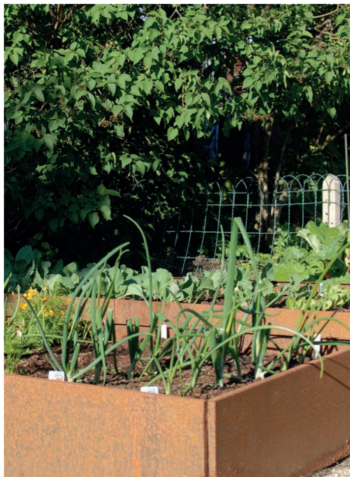
Køkkenhave / urtebede