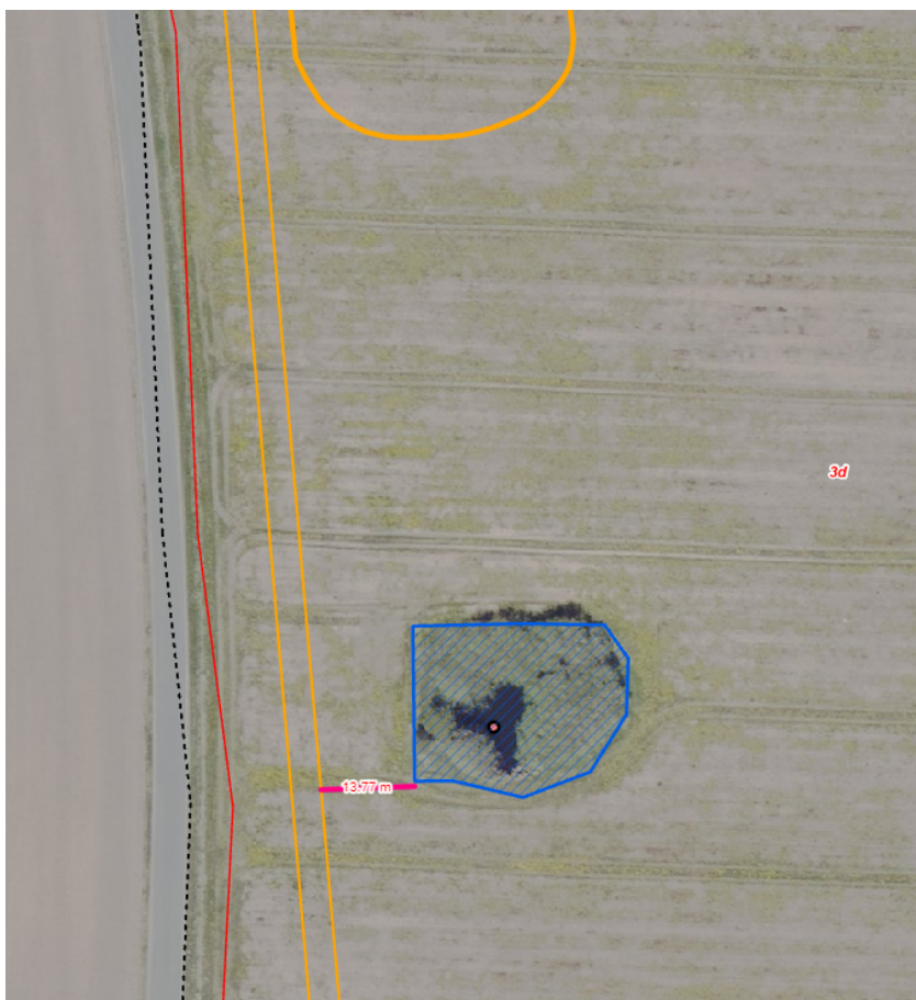
Figur 1: Beskyttet sø er vist med blå skravering. Ridebanens placering er vist med gult.