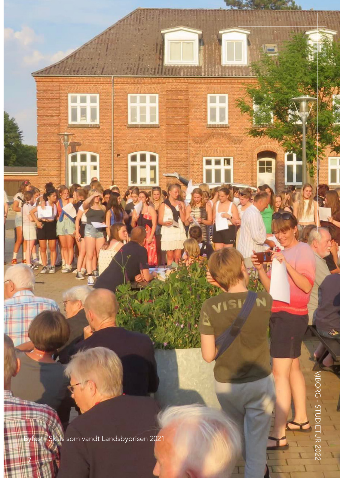
Byfest i Skals som vandt Landsbyprisen 2021